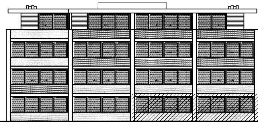
achtergevel gebouw 1